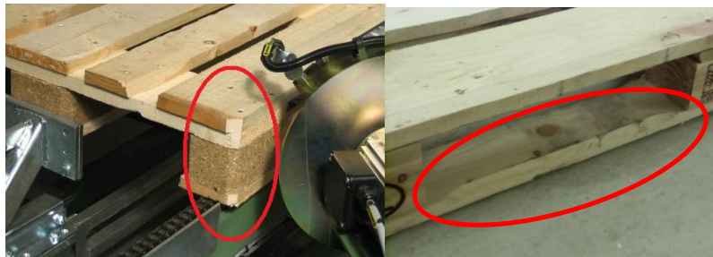
Abbildung 4: 4 Ecken gekappt und 3 Bodenbretter gefast

Alle drei Bodenbretter müssen im Überrollbereich gefast (Abschrägung um 45°) sein. Hierdurch wird der Absplitterung der Bodenbrettoberkanten vorgebeugt und die Überfahrbarkeit durch Flurförderfahrzeuge erleichtert.